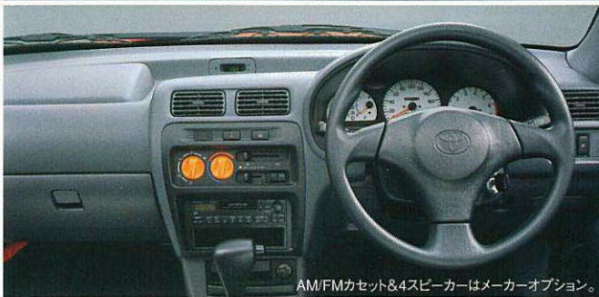
AM/FMカセット&4スピーカーはメーカーオプション。