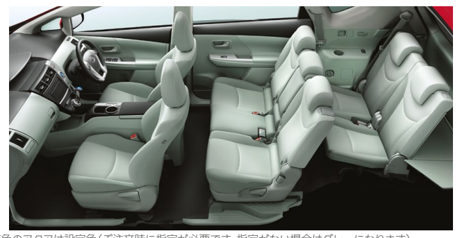
Photo:S"ツーリングセレクション" (7人乗り)。ボディカラーはレッドマイカメタリック〈3R3〉。内装色のアクアは設定色(ご注文時に指定が必要です。指定がない場合はグレーになります)。 オーディオレスカバー<1,296円(取付費が別途必要)>は販売店装着オプション。