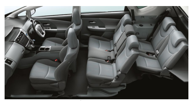
Photo:G"ツーリングセレクション" (7人乗り)。ボディカラーのホワイトパールクリスタルシャイン〈070〉<32,400円>はメーカーオプション。 内装色のグレーは設定色(ご注文時に指定が必要です。指定がない場合はアクアになります)。オーディオレスカパー<1,296円(取付費が別途必要)>は販売店装着オプション。