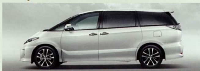
ホワイトパールクリスタルシャイン(070)*1