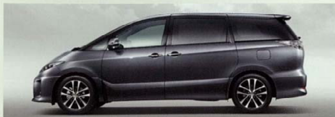
アイスチタニウムマイカメタリック(1H4)