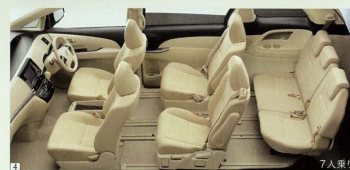
Photo(4):アエラス(3.5L・7人乗り)2WD。内装色のシェルは設定色(ご注文時に指定が必要です。指定がない場合はブラックになります)。盗難防止システム(エンジンモビライザー+オートアラーム)、G-BOOK mX Pro専用DCMはセット<68,040円>でメーカーオプション。HDDナビゲーションシステム&エスティマ・パノラミックライブサウンドシステム+音声ガイダンス機能付カラーバックガイドモニター<386,640円>はメーカーオプション。