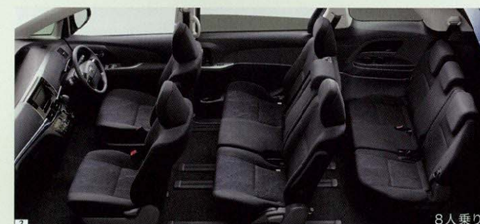
Photo(1・2・3):アエラス(2.4L・8人乗り)2WD。ボディカラーはグレイッシュブルーマイカメタリック(8V5)。内装色はブラック。オーディオレスカバー<1,296円(取付費が別途必要)>は販売店装着オプション。