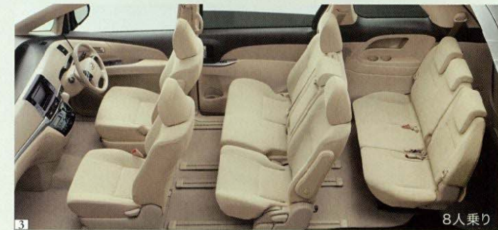
Photo(1・2・3):X(2.4L・8人乗り)2WD。ボディカラーはシルバーメタリック(1F7)、内装色はシェル。オーディオレスカー<1,296円(取付費が別途必要)>は販売店装着オプション。