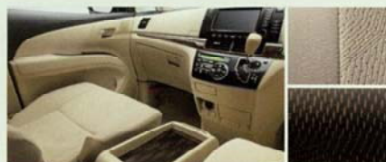
■内装色:シェル[設定あり] ■シート表皮:アエラス専用トリコット ■インテリアパネル:サイバーカーボン調(ブラウン) (サテン調シルバー加飾モール付)