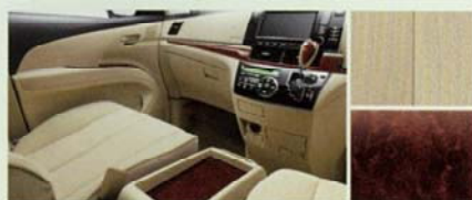
■内装色:シェル ■シート表皮:ジャカード織物 ■インテリアパネル:パズアイ木目調 (サテン調シルバー加飾モール付)