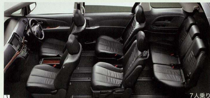
Photo(1・2・3):アエラス“レザーパッケージ”(3.5L・7人乗り)2WD。ボディカラーはアイスチタニウムマイカメタリック(1H4)。内装色はブラック。 HDDナビゲーションシステム&エスティマ・パノラミックスーパーライブサウンドシステム+音声ガイダンス機能付カラーバックガイドモニター<555,120円>、パワーバックドア<59,400円>、SRSサイドエアバッグ&SRSニーエアバッグ&SRSカーテンシールドエアバッグ<81,000円>はメーカーオプション。