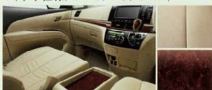
■内装色:シェル ■シート表皮:本革*2*3 ■インテリアパネル:パズアイ木目調 (サテン調シルバー加飾モール付)