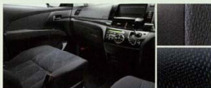
■内装色:ブラック ■シート表皮:アエラス専用トリコット ■インテリアパネル:サイバーカーボン調(ブルー) (サテン調シルバー加飾モール付)