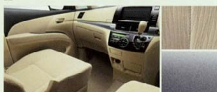
■内装色:シェル ■シート表皮:トリコット ■インテリアパネル:シルバー塗装 (サテン調シルバー加飾モール付)