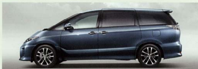
グレイッシュブルーマイカメタリック(8V5)