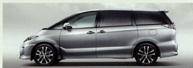
シルバーメタリック(1F7)