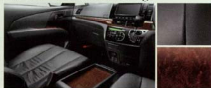
■内装色:ブラック ■シート表皮:本革*2 ■インテリアパネル:パズアイ木目調 (サテン調シルバー加飾モール付)