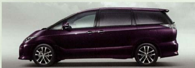
ボルドーマイカメタリック(3R9)